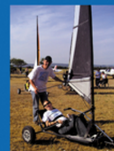
Journée char à voile

Vous bénéficierez d'une déduction d'impôt de 66% du montant de vos dons, limitée à 20% de votre revenu imposable. CGI art.200.