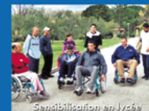
Sensibilisation en lycée