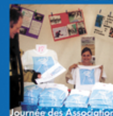
Journée des Associations