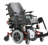
Invacare TDX® SP & TDX® SP NB