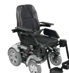
Invacare Storm®4 Family