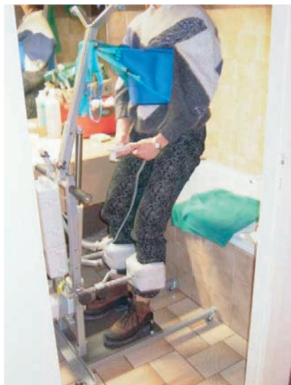
OPTION VERTICALISATION AVEC SANGLE DE BUSTE