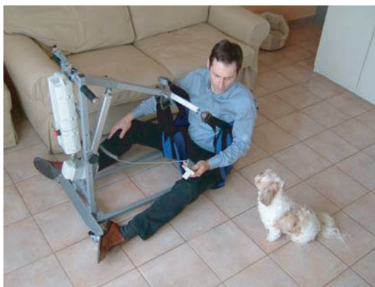
RECUPERATION D'UNE PERSONNE AU SOL