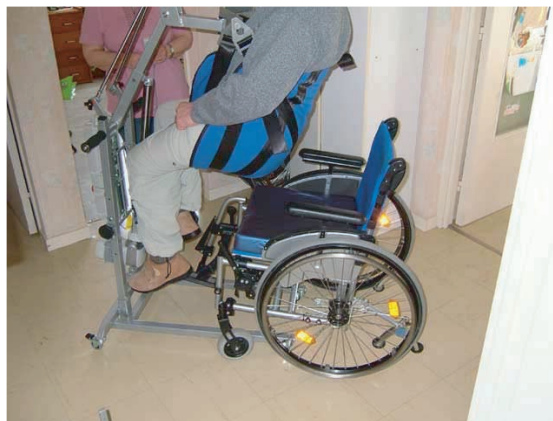
LEVAGE EN POSITION ASSISE