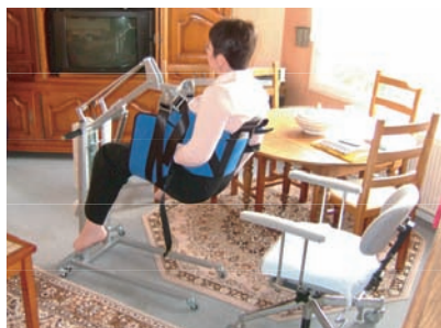
SANGLE 2 PARTIES