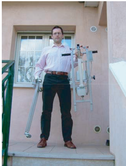
DEMONTABLE ET FACILE A TRANSPORTER