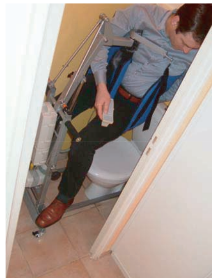
ACCES DANS LES WC LES PLUS REDUITS

IDEAL POUR LES ESPACES REDUITS Sans modification de votre habitat