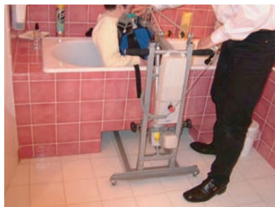
ACCES BAIGNOIRE EN DIRECT AVEC PASSAGE SOUS LA BAIGNOIRE