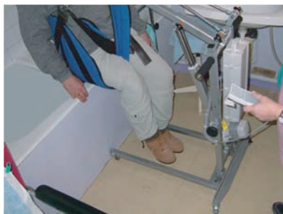
ACCES BAIGNOIRE ASSIS LATERAL SANS PASSAGE SOUS LA BAIGNOIRE