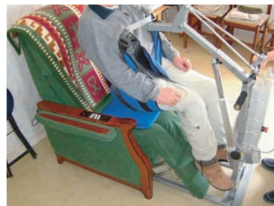
ACCES FAUTEUIL CONFORT